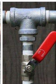
Thép Mạ Kẽm & Van